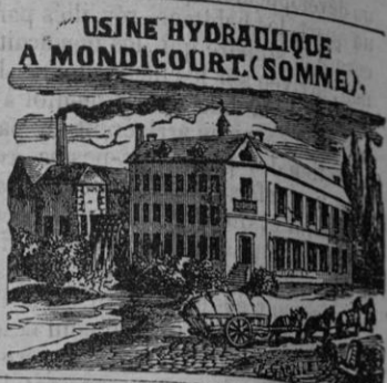
USINE HYDRAULIQUE A MONDICOURT (SOMME).

FAIRE DU BON ET AU MEILLEUR MARCHÉ POSSIBLE, celle est la question économique dont on chercheait depuis longtemps la solution. Préoccupés de cette pensée, MM. IBLED frères et C ont conçu l'heureuse idée d'établir, au centre d'une population nombreuse où la main-d'œuvre est à très bon compte, une vaste usine qui n'a à redouter aucune concurrence. Ils viennent d'établir leur dépôt central, à Paris, rue des Coquilles, 4, près de l'Hôtel-de-Ville, une seconde usine à vapeur où les consommateurs peuvent venir se convaincre des avantages qu'offrent les produits de leur fabrique, fabriqués sous le double rapport de la qualité et du bon marché.