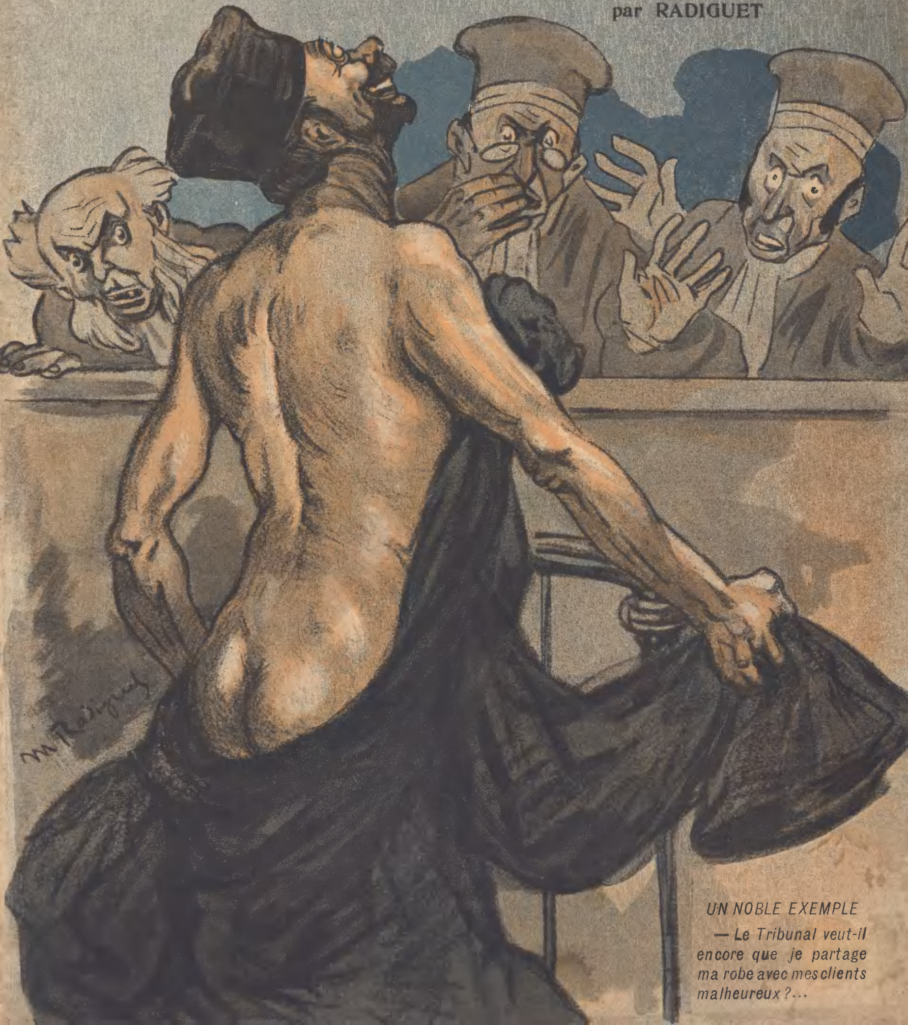
UN NOBLE EXEMPLE — Le Tribunal veut-il encore que je partage ma robe avec mes clients malheureux ?...