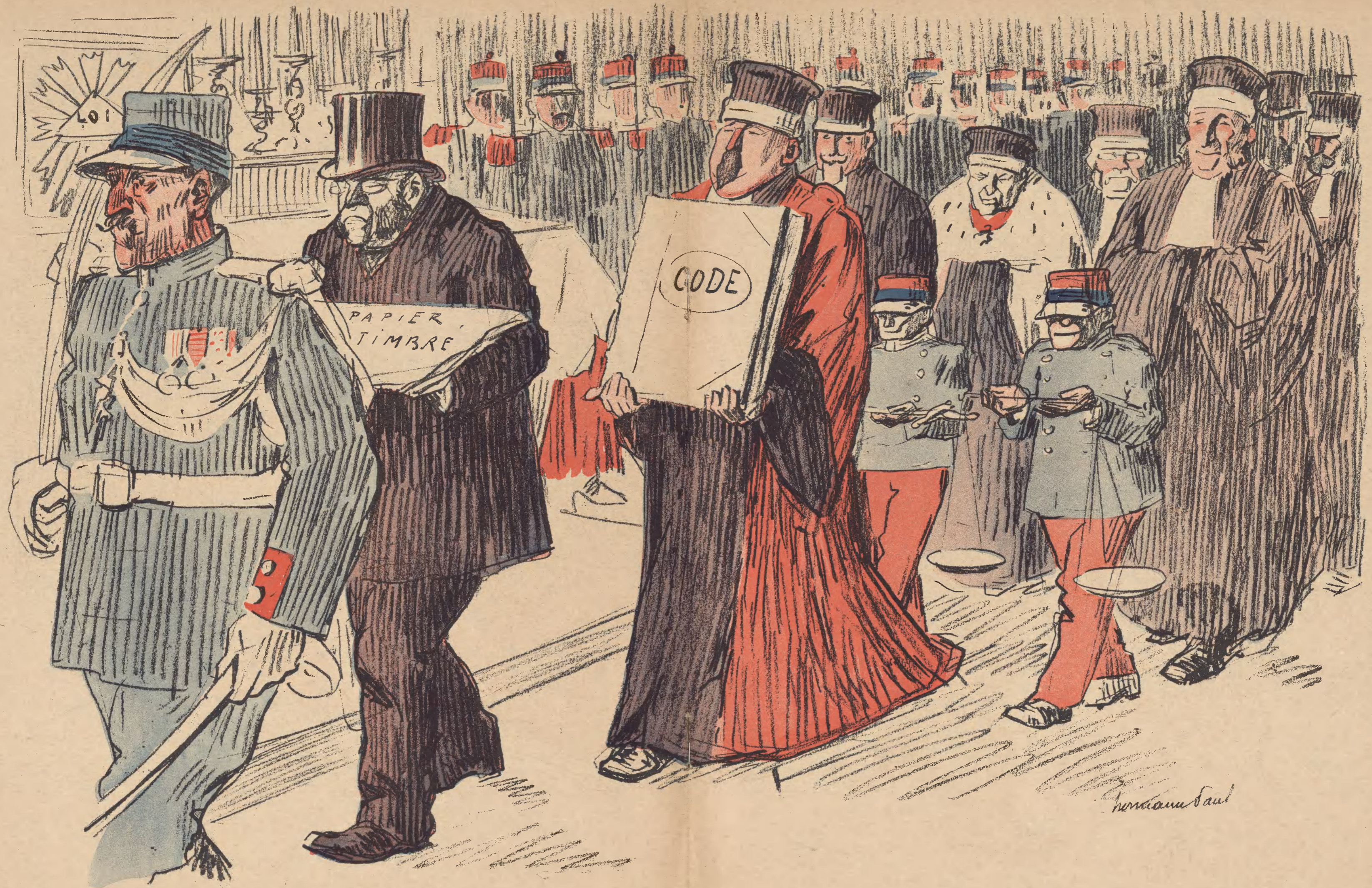
LES CÉRÉMONIES DU CULTE.