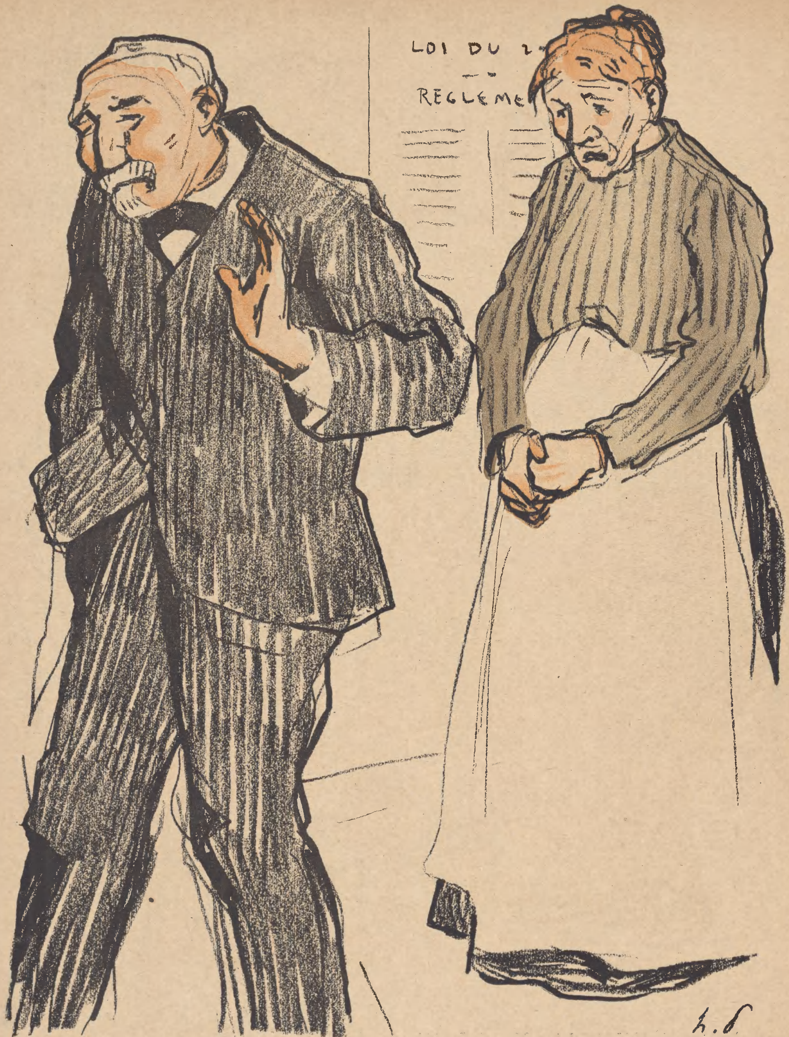
AU NOM DE LA LOI, LE PATRON AFFAME.